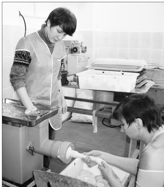
Все изделия «Агрофирмы АРФЕДО» выпускаются строго по ГОСТу и не содержат никаких пищевых добавок.