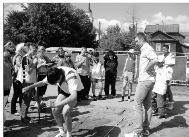
Юноши и девушки боролись, как и положено в настоящем спорте, по строгим правилам — скидок на ограниченные возможности судьи не делали никому.