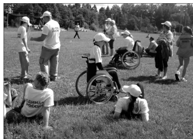
Больше всего дети радовались чистому воздуху, удивительной, почти звенящей тишине и свободе общения со сверстниками.