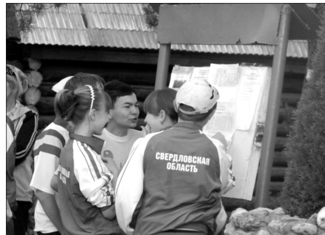
В первый день спартакиады молодые люди волновались особенно. Даже на построение команд собрались раньше назначенного времени.