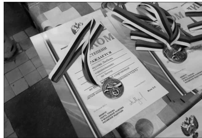
Самых выносливых, сильных и смелых, а точнее, всех, ждали медали и призы — проигравших попросту не оказалось.