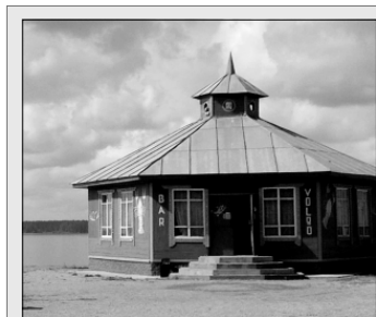
урожай ягод и грибов, а также побывать на экскурсиях по Селигеру, зимой отправиться на прогулку в лес на легкой русской тройке. Одним словом, полноценный отдых круглый год — главное настроение «Чайки».

нии первых семи видов спорта ребята знали практически с рождения, то о последнем некоторых не ведали аж до приезда на турбазу. Хотя, как оказалось, бочка, или метание в цель тяжелого кожного мяча размером чуть больше теннисного, появилась на свет довольно давно — еще в Древней Греции. Правда, со временем игра претерпела некоторые изменения. Сейчас бочка рассчитана, скорее, на оздоровительный эффект, чем на развлекатель-