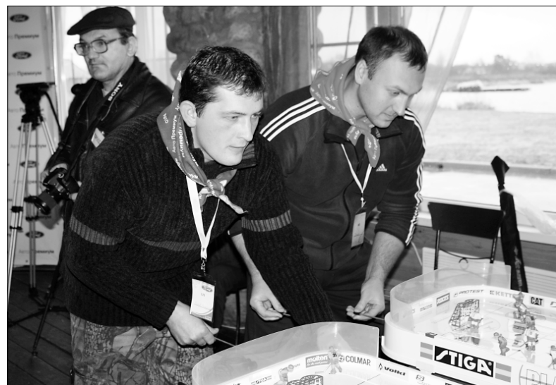
Настольный хоккей давно уже не воспринимают как детскую игрушку: накал страстей здесь такой же, как и в настоящих ледовых баталиях.

О том, что дальнейшее развитие экономики невозможно без инновационного подхода, сегодня говорит большинство экспертов. Однако до сих пор многие инноваторы не знают, как внедрить свои идеи в производственный процесс. А те, кто все же начал внедрять, сталкиваются с целым рядом проблем